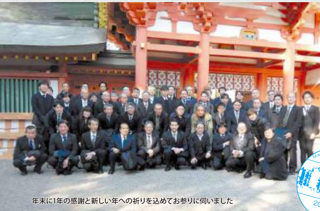
年末に1年の感謝と新しい年への祈りを込めてお参りに伺いました