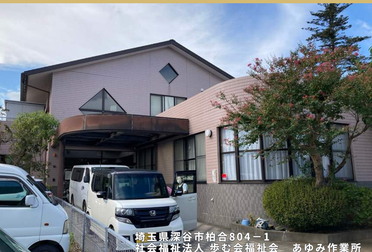
埼玉県深谷市柏合804-1 社会福祉法人 歩む会福祉会 あゆみ作業所